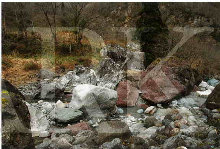
小滝ヒスイ峡(新潟県糸魚川市)

講演会では糸魚川で活動されているの方々をお招きしてお話をうかがい、男鹿市、潟上市、大潟村における、ジオパーク認定に向けた活動の方向、取り組み方などを探ります。