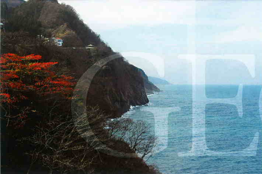
親不知海岸(新潟県糸魚川市)