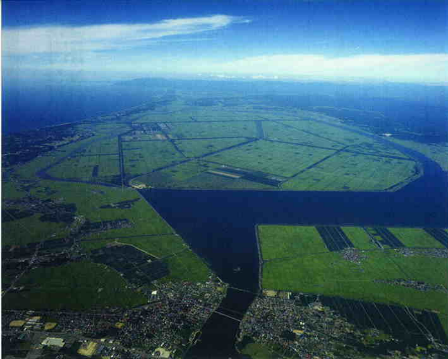
人工の大地・大潟村